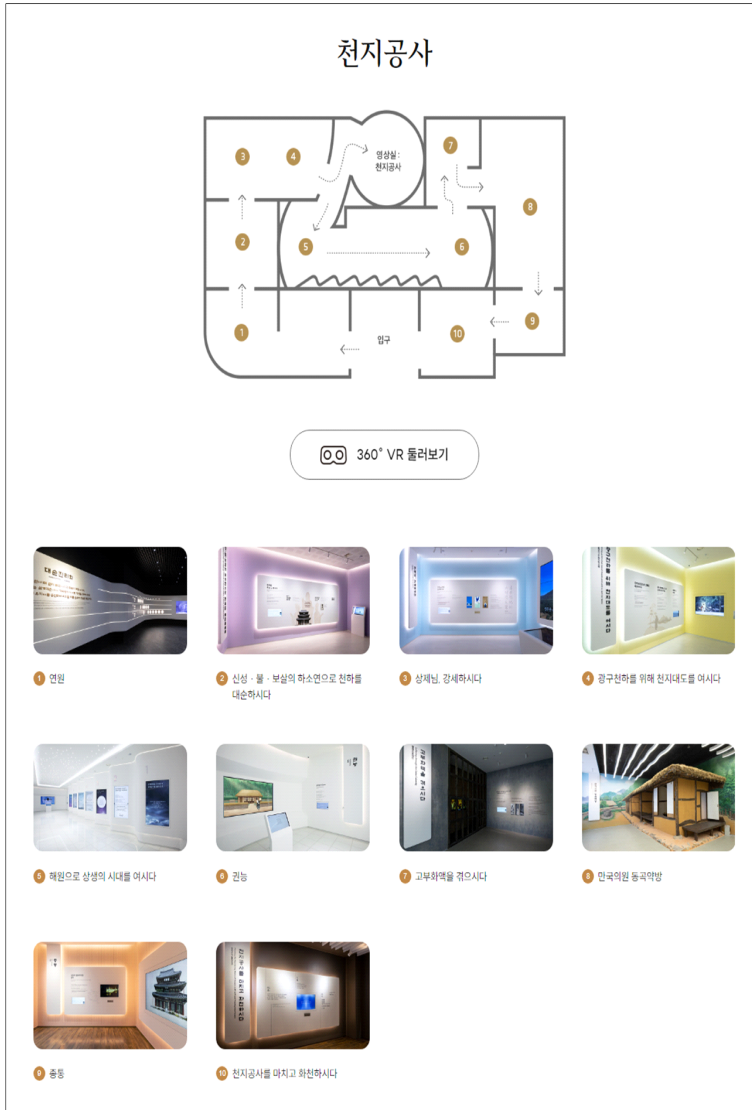
<그림 2> 대순진리회박물관 4층 공간의 구조21)