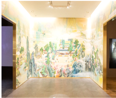
<그림 2> 4층 전시관

45) 137개의 회원국을 보유한 유네스코 공식 자문기구. 문화유산 보존, 복원과 관련된 과학적, 기술적, 윤리적 문제와 관련한 정보 수집, 연구 및 배포, 국제회의, 전문가 교류 등을 통해 해당 분야의 연구 및 갈등 조정, 교육자료개발 등 다양한 측면에서 활동하고 있다.