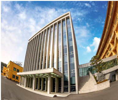
<그림 1> 대순진리회박물관 전경