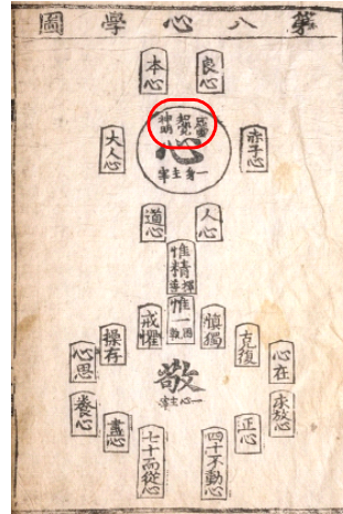
<그림 5> 「심학도」의 허령, 지각, 신명

의 허령·지각·신명에 대한 구분은 조선 주자학의 심학도와 유사한 구조를 보인다고 할 수 있다. 그러나 이러한 학문적 유사성에 비하여, 대순사상에서 마음에 관한 기존의 연구는 유심론이나 양명학의 입장을 위주로 하여 인간의 마음을 본체로 그 자체로 여기는 경향이 강하였다. 또한 마음에 드나드는 신을 외재신에 국한시켜 이해하였다. 하지만 대순사상의 본체가 태극이라는 점과 「각도문」의 리가 심법을 정한다는 측면, 그리고 마음을 기관으로 여김은 마음이 곧 본체라는 입장과 상반된다. 또한 나의 혼백과 정신 그