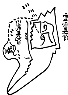
〈그림 1〉『현무경』의 虛靈符

주자학에서는 천지인의 삼재가 태극이라는 하나의 원리로 이뤄지며, 태극은 만물에 이르러서는 리(理)로, 사람에게 이르러서는 성(性)으로 칭해진다. 이러한 삼재에 적용되는 공통된 원리가 있다는 주자의 세계관은 마음에 있어서도 마찬가지이다. 주자는 “하늘과 땅과 사람에 모두 같은 마음이 있는 것이며, 하늘 아래의 만물 또한 아무리 미세한 것이라도 모두 마음