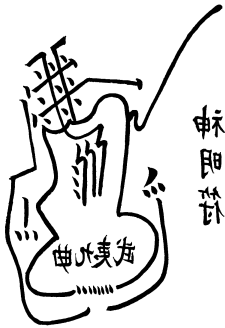
〈그림 4〉 『현무경』의 神明符

마음에서 정신혼백이 유기적으로 작용할 때 신명한 모습을 띠고 허령한 능력을 드러낸다. 99) 정상과 신명은 마음의 두 측면을 말한 것으로, 정상은 심의 기가 갖는 물리적 특성으로서 다른 기와 구별되는 차이점을 말한 것이고, 신명은 정상한 마음의 기가 갖는 표현적인 특징을 말한 것이다. 바꿔 말하면 정상은 심의 기, 즉 심을 이루는 소재 자체가 갖는 내면적 특징이며, 신명은 그 기의 기상·형상이 갖는 외면적 특징이다. 100) 여기서의 신명의 외면적 특징은 바로 주체로 일신을 주재함을 말한다.