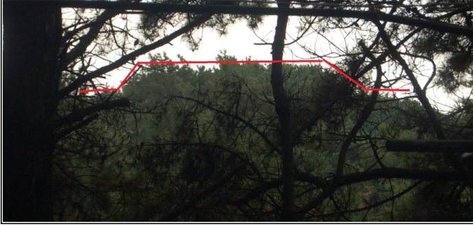
<그림 3> 주산의 거문 토성