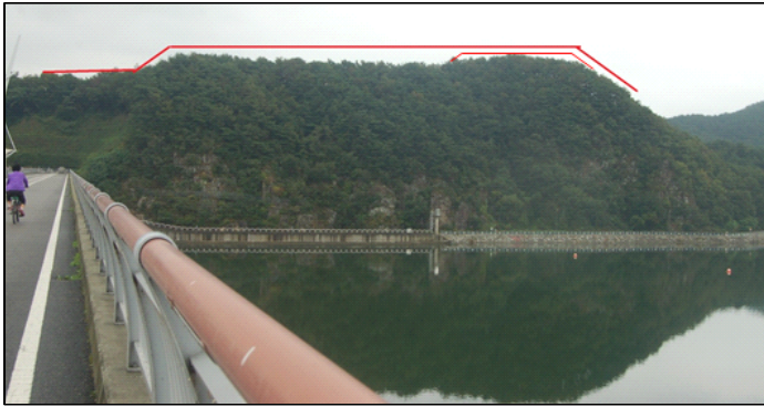
<그림 4> 토성 안산의 뒷 형상

이러한 땅은 풍수지리의 법도를 알아도 찾기 어려운 신안(神眼)의 경지의 이르러 천지가 감응하여 진인(真人)에 알려준 곳인데, 도조 증산의 천지공사 속에서 그 실마리를 찾을 수 있다. 이러한 내용은 대순진리회의 진법주(眞法呪)에 담겨 있다. 진법주 맨 마지막 발원문에서는 “하늘에서 길한 자리를 감추어서 진인에게 주시나니, 부디 숨기지 마시고 보여주시어 소원을 다 이루도록 해 주십시오.” 77) 라고 기원하는 것