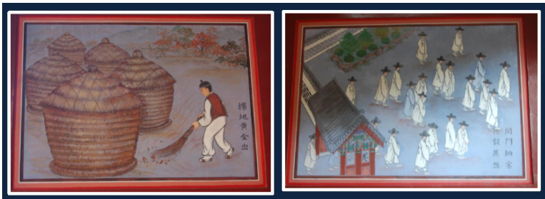
<그림 5> 여주본부도장 포정문의 좌우벽화

포정문을 들어와서 그대로 서서 바라보면 오른쪽 산능선이 청룡이고 왼쪽이 백호인데, 주밀하게 용호가 교쇄(交鎖)되어 있어서 생기가 빠져나갈 수 없이 물샐 틈이 없는 곳이다. 이런 곳은 재물이 쌓이고 풍요로운 기운이 있는 땅인데, 포정문에 그러한 사실을 말해주는 벽화가 그려져 있는 것을 발견하니 이미 풍요로운 땅의 지기를 읽었던 것이 확실하다. 포정문의 안쪽에서 볼 때 왼쪽 벽면에는 마당을 쓸면 황금이 나온다는 ‘소지황금출(掃地黃金出)’이라는 벽화가 그려져 있고, 오른쪽에는 문을 열고 손님을 맞으니 그 수가 무수하다는 의미의 ‘개문납객 기수기연(開門納客 其數其然)’의 벽화가 그려져 있다. ‘소지황금출 개문백복래(掃地黃金出 開門萬福來)’는 일찍 일어나 마당을 쓸면 황금이 나오고 새벽에 대문을 열면 만복이 들어온다는 『추구집(推句集)』 85) 에 나오는 구절로서 입춘첩에도 사용하던 시구인데, 대순진리회에서는 특별히 다음과 같은 의미가 있다.